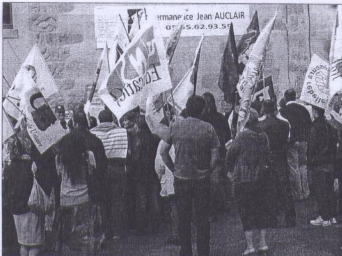
Une soixantaine de personnes a répondu présente à une action coup de poing.

L'intersyndicale donne rendez-vous mercredi pour une votation citoyenne contre la réforme des retraites devant la Préfecture de la Creuse, à Guéret, de 12h à 14h et de 17h à 19h.