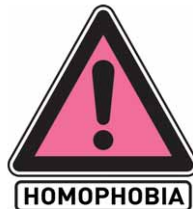
Journée mondiale de lutte contre l'homophobie : 17 mai 2007