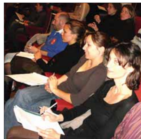
Colloque sur la scolarisation des élèves handicapés le 20 mars à Paris : une nécessité de débattre et d'entendre d'autres expériences.

Le tuilage avec les anciens dispositifs a été insuffisant : des centaines de dossiers en souffrance, la non prise en charge des projets personnalisés de scolarisation (PPS), l'absence/suppression des moyens de fonctionnement des enseignants référents (déplacements, téléphone, internet, ordinateur...). La question de la transparence du